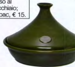
Resistente agli shock termici la tajine da sei di Emile Henry, € 99,90.