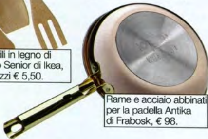
Rame e acciaio abbinati per la padella Antika di Frabosk, € 98.