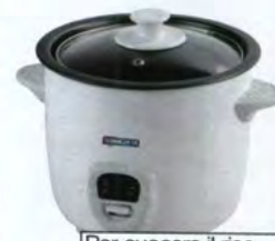
Per cuocere il riso conservandone le proprietà nutritive. Di Termozeta, € 29,90.