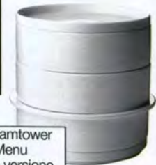
Steamtower di Menu è la versione in ceramica del cestello a vapore in bambù, € 69.