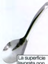
La superficie lavorata non fa attaccare cous-cous e riso al cucchiaino; di Ipac, € 15.