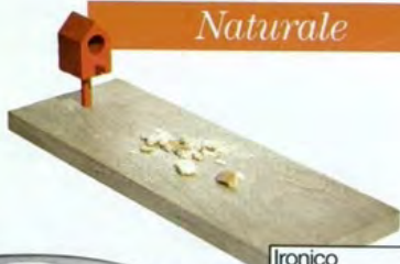
Ironico il tagliere con casetta per gli uccellini di Pigr, € 48.