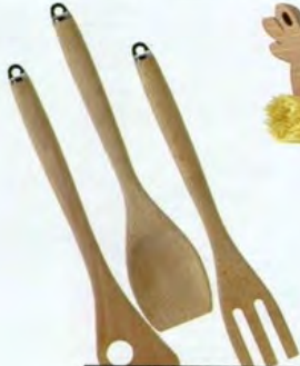
Utensili in legno di faggio Senior di Ikea, tre pezzi € 5,50.