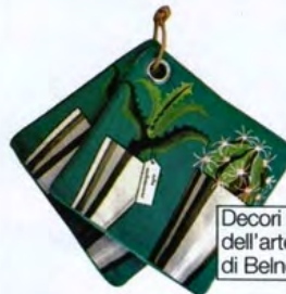
Decorati tratti dal mondo dell'arte sulle presine di Belnotes.it, € 24.