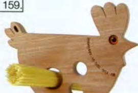
Padovana è la gallina dosaspaghetti di Legnomagia, € 19.