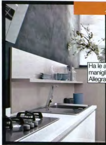
Ha le ante senza maniglia la cucina Allegra di Stosa.